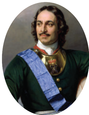
Император Петр I

Сообщениями «о похищении казны» первоначально занималась тайная канцелярия во главе с графом П.А. Толстым. И работала она на совесть. Но были и такие дворяне и чиновники, которые к проблеме мздоимства относились гораздо терпимее. По рассказам современников, однажды в Сенате Петр пригрозил издать указ, по которому всякий, кто украдет у казны сумму, на которую можно купить веревку, будет повешен. Генерал-прокурор Ягужинский на это заметил: «Неужели вы хотите остаться императором без служителей и подданных? Мы все воруют — с тем только различием, что один больше и приметнее, чем другой».