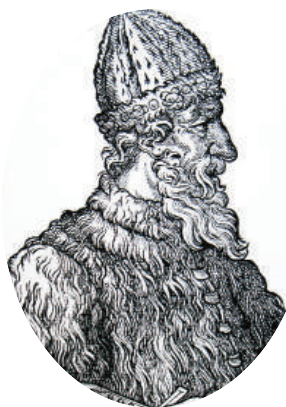
Великий князь Иван III

До XVIII века чиновники на Руси жили благодаря так называемым «кормлениям», то есть, при отсутствии оклада за исправление должности, разрешению на подношения от заинтересованных в их деятельности лиц. Одаривали их не только деньгами, но и «натурой» — мясом, рыбой, пирогами и пр., что было делом обыкновенным.