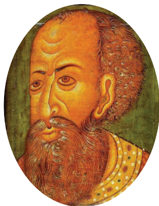
Царь Иван IV Грозный