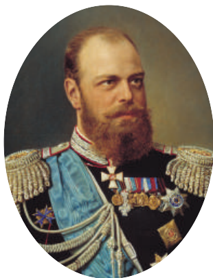
Император Александр III