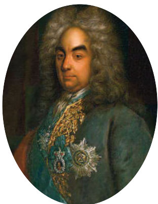
Петр Андреевич Толстой