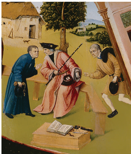
Фрагмент «Алчность» картины Иеронима Босха «Семь смертных грехов»

Рассматривая участников коррупции на примере взяточничества, стоит отметить, что в коррупционном процессе всегда участвуют две стороны. Одна сторона — это взяткополучатель (подкупаемый). Вторая сторона — это взяткодатель (осуществляющий подкуп). Также в процессе может участвовать и третья сторона — посредник.